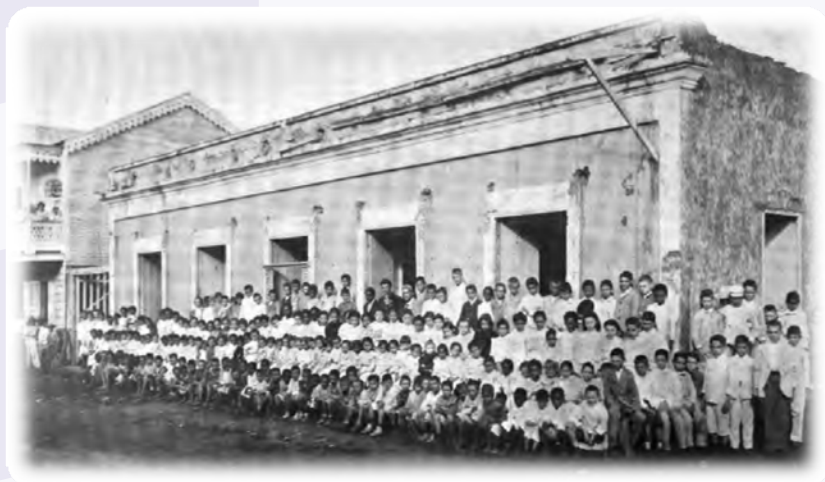
Ilustración 1. Escuela pública en Manatí, 1899