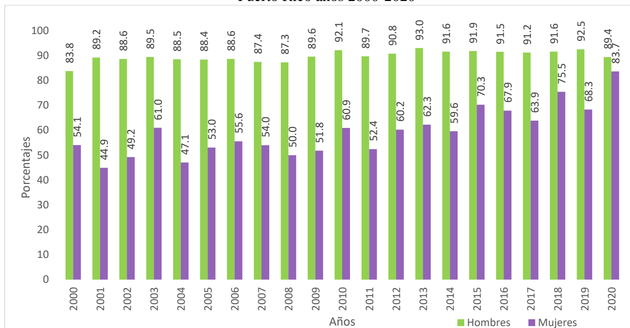
Figura 2. Proporción de homicidios por armas de fuego en víctimas entre 10 y 39 años de edad: Puerto Rico años 2000-2020